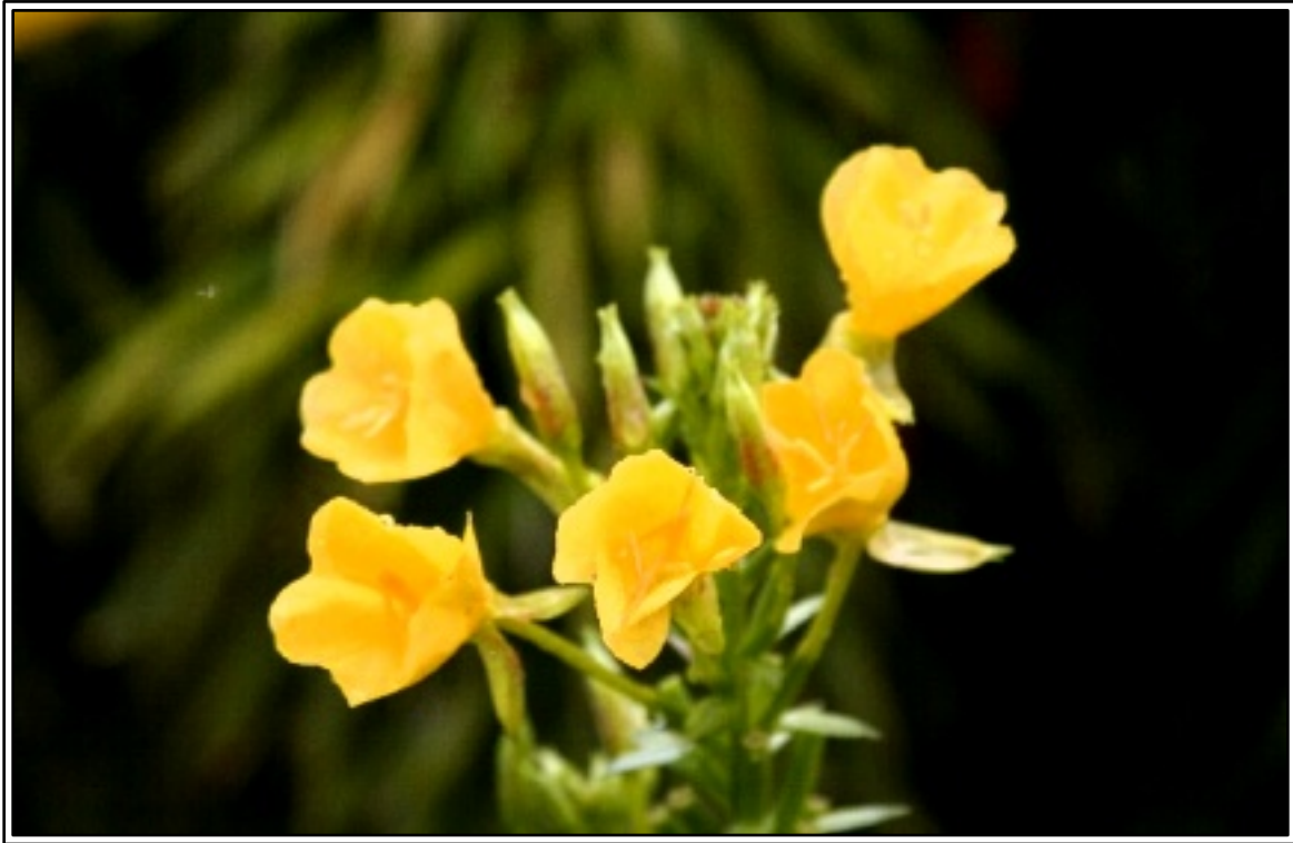
▲ 今年、突然境内地に咲きました。何の花？ (9月6日撮影・当山)