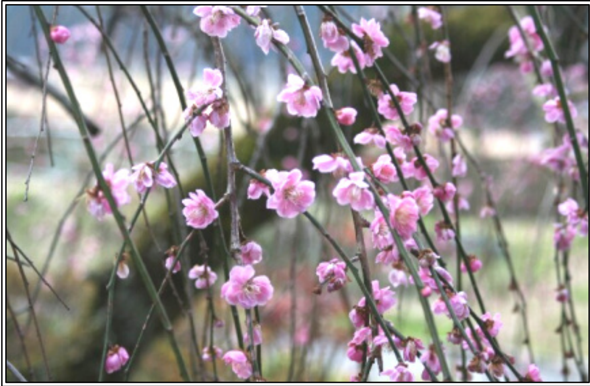
▲ 例年よりはずいぶん早く見ごろを迎えました (3月5日撮影・当山)