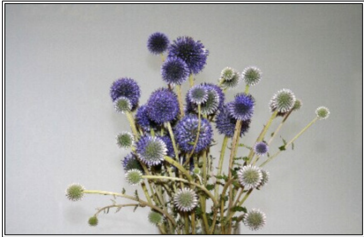
▲ ヒゴタイ 切り花でいただきました