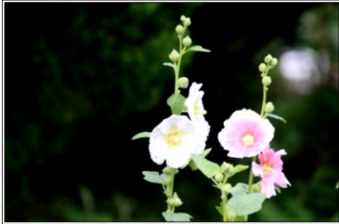
今年も葵が咲きました。葵を見ると黄門さまを思い出します。