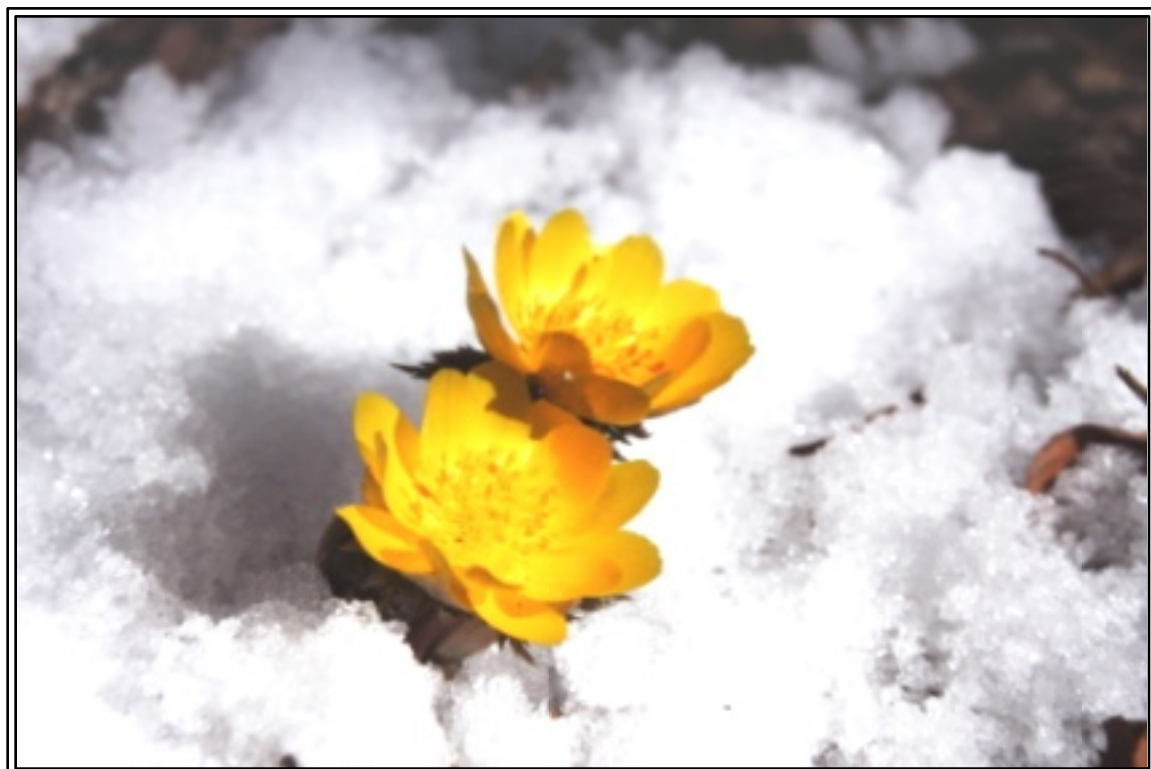
雪とフクジュソウ (古い写真でごめんなさい)