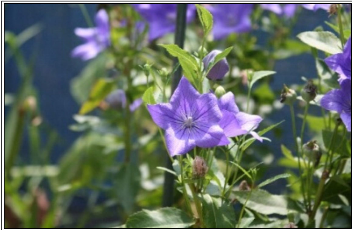
▲ 厳しい日ざしに負けず咲く桔梗 (8月6日撮影)